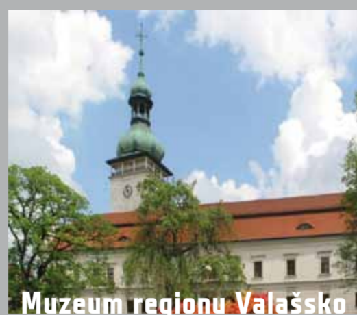
Muzeum regionu Valašsko