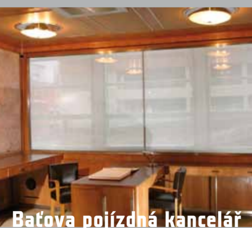
Baťova pojezdňá kancelář