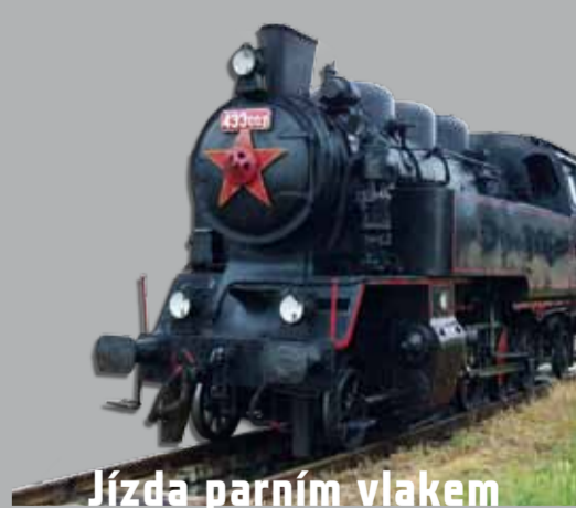
Jízda parním vlakem